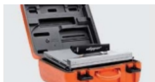
USOR DE TRANSPORTAT