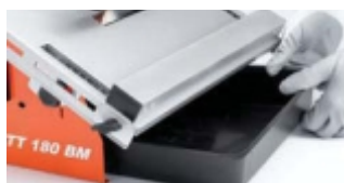
TAVA DIN PLASTIC DETASABILA