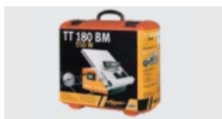
VALIZA PENTRU TRANSPORT